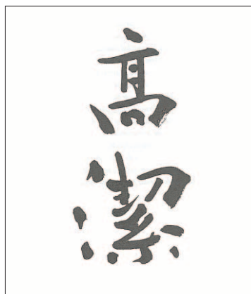
Ilustración de Miyamoto