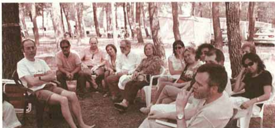
Abella en un momento de su intervención

Atardece el seis de junio en San Benito.